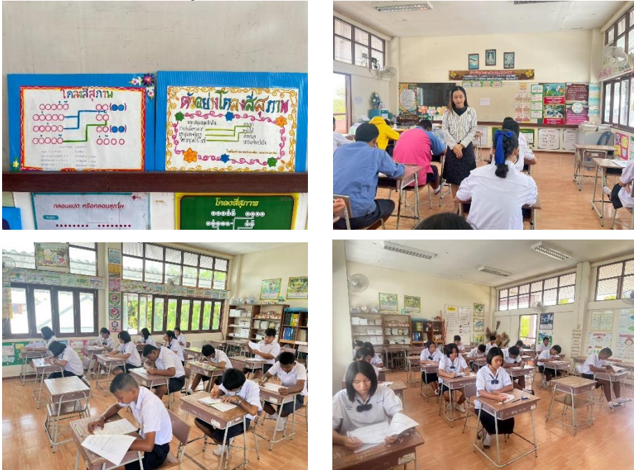
ผลงานนักเรียนจากการจัดการเรียนรู้ เรื่อง โคลงสี่สุภาพ (กิจกรรมกลุ่ม)

Step 5 Self-Regulating (ขั้นประเมินเพื่อเพิ่มคุณค่าบริการสังคมและจิตสาธารณะ) ผู้เรียนมีจิตสาธารณะและเห็นคุณค่าในผลงาน สามารถนำผลขยายผลหรือต่อยอดองค์ความรู้นั้น เพื่อนำไปใช้ให้เกิดประโยชน์ต่อส่วนรวม โดยทำเป็นสื่อการเรียนรู้เรื่องคำพ้อง จัดไว้ประจำห้องเรียนภาษาไทยต่อไปอย่างมีประสิทธิภาพ