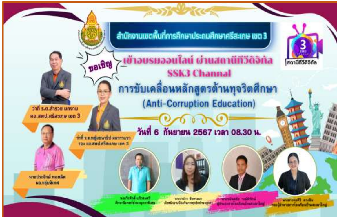
วิทยากรนำเนอผลงาน การขับเคลื่อนหลักสูตรด้านทุจริตศึกษา ผ่านสถานีโทรทัศน์ทีวีดิจิทัล SSK3 สำนักงานเขตพื้นที่การศึกษาประถมศึกษาศรีสะเกษ เขต 3