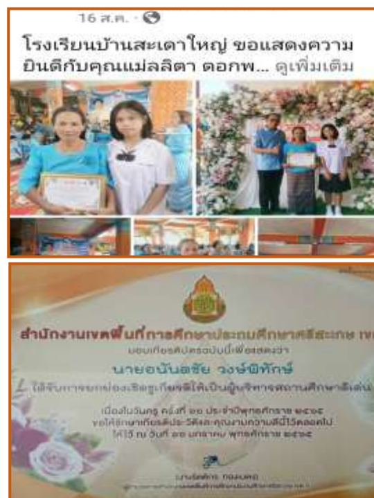
ได้รับการยกย่องเชิดชูเกียรติ ให้เป็นผู้บริหารสถานศึกษาดีเด่น สำนักงานเขตพื้นที่การศึกษาประถมศึกษาศรีสะเกษ เขต 3